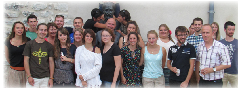
Etudiants de licence professionnelle - promotion 2014-2015.

Pour en savoir plus sur cette filière, contactez le CFPPA du Pradel au 04 75 36 71 80 ou le site internet du Cermosem, rubrique formation : https://iga.ujf-grenoble.fr/presentation/cermosem/formation