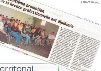
La quinzième promotion de la licence professionnelle est diplômée