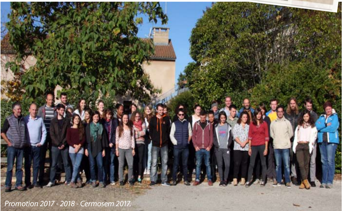
Promotion 2017 - 2018 - Cermosem 2017.