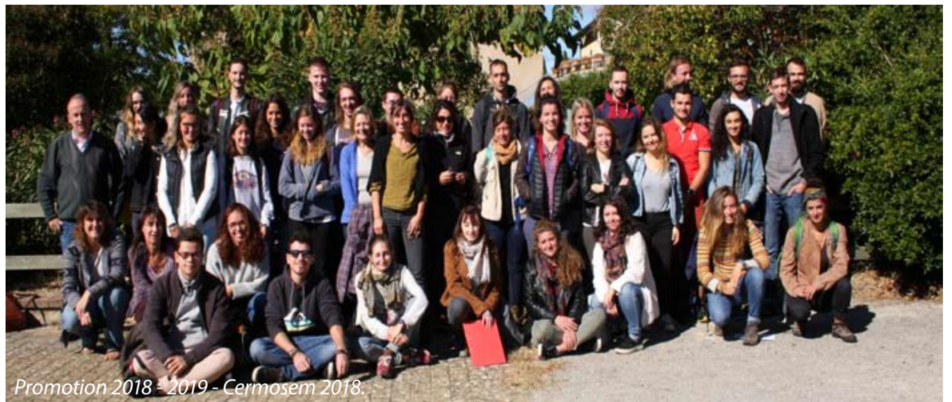
Promotion 2018 - 2019 - Cermosem 2018.

Actuellement, deux candidat(e)s en guide conférencier et une candidate en concepteur de produits touristiques patrimoniaux préparent leur dossier, sur la base d'un mémoire réflexif, élaboré à partir de leurs expériences en lien avec le diplôme préparé.