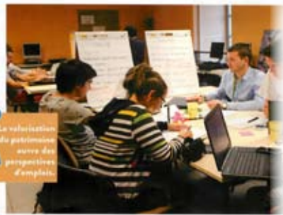
La valorisation du patrimoine ouvre de perspectives d'emploi.

Une nouvelle licence professionnelle au Prodrel