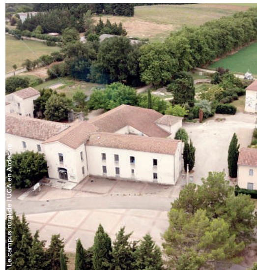
Le campus rural de l'UGA en Ardèche